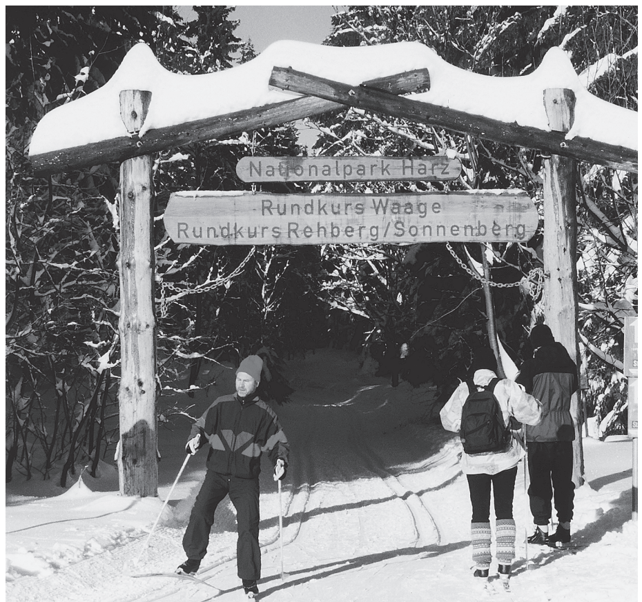
St. Andreasberg schuf mit dem Nationalpark Harz, dem Harzer Verkehrsverband und den umliegenden Wintersportorten ein Verbund-Loipennetz.

Die Kosten für Kommunen bestehen aus einer einmaligen Basisgebühr in Höhe von 500 Euro zuzüglich Marketing-Umlage (jährlich): 1 Euro je 1.000 Übernachtungen/Jahr, maximal jedoch 1.000 Euro. □